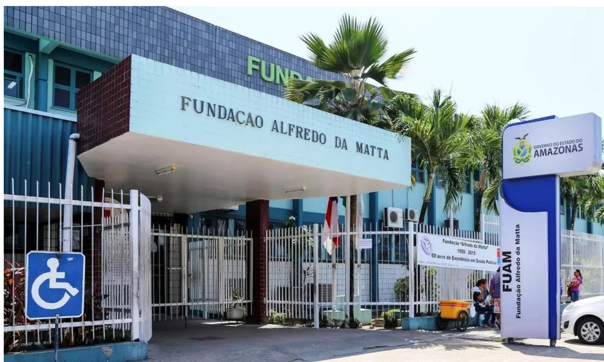
Figura 1: Fundação Alfredo da Matta

O estudo ocorreu integralmente na Farmácia Especializada da Fundação Alfredo da Matta (Figura 1), instituição integrante do SUS e vinculada à Secretaria de Estado de Saúde do Amazonas.